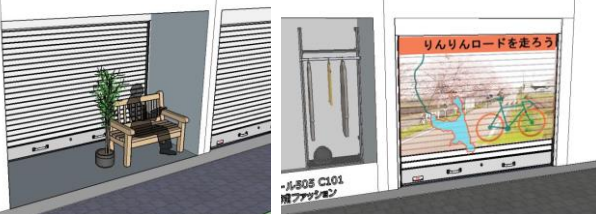
街路と一体化した商店街デザイン